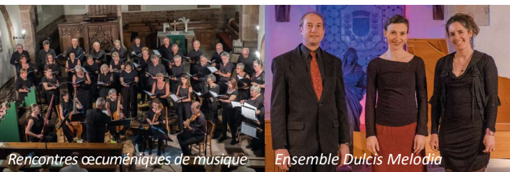
Rencontres œcuméniques de musique

Pour tous renseignements sur les Rencontres œcuméniques de musique , vous pouvez consulter la brochure spécifique.