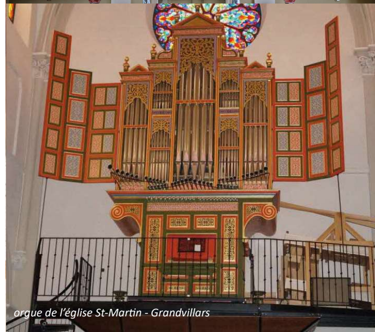
orgue de l'église St-Martin - Grandvillars

Renseignements et inscriptions : 06 81 19 84 72 (date limite d'inscription : 2 juin 2024)