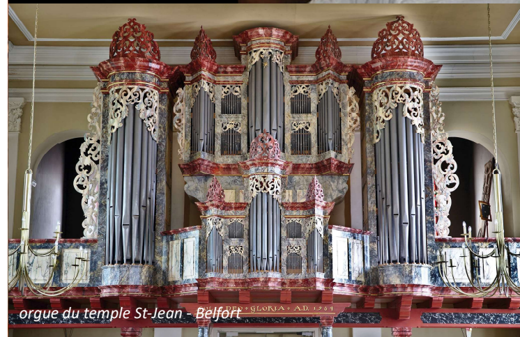
orgue du temple St-Jean - Belfort