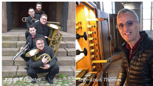
Brassi K Quintet

Au programme figureront des œuvres de Haendel, Strauss, Mancini, Piazzolla et Morricone.